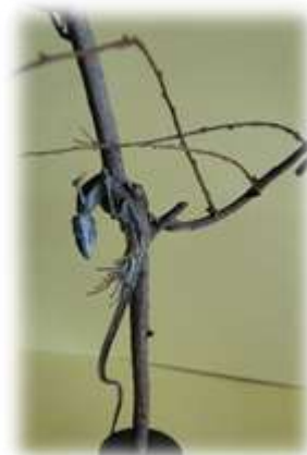
（「モズのはやにえ」 グランドの藪で見つけたもの）

世界の食糧事情が大きく変わっています。もはや大量生産・大量消費・大量廃棄の時代ではないのです。私たちは本当に必要な食べ物をよく考え、選び、決して無駄にしないサイクルをこれから真剣に考えていく必要があります。SDGs（持続可能な開発目標）の考え方・捉え方によれば、「日本人は食べ物をどんどん捨てている」それでいて「日本人は食糧自給率は低い」ということです。これは単純に考えれば「食べ物は外国からお金で買っちゃえ。買ったからには食べるのも捨てるのも自由。」ということですが。世界では飢えで亡くなっていく子供たちはいまだに多いのです。私たちが見ていない・見えていないから実感としてないだけです。私たちにできることは「可哀そう」で済ますことではなく、まずは日本で無駄になる食べ物をいかに減らすか。という具体的な努力だと思います。SDGsでは17の目標のうち2番目に「飢餓をゼロに」と掲げています。