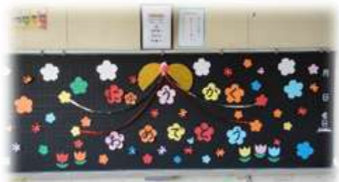
(新しい上谷っ子を待つ黒板)

「笑顔でいる」ということです。分かり易い例を一つ言います。皆さんは「あいさつ」もよくできますが、「おはようございます」と元気に挨拶できたら、あいさつした人にニコッと笑ってみましょう。「さようなら」も同じです。一度やってみましょう。・・・お友達が増えますよ。次に大切な事は「お勉強」です。先生の言うことをよく聞いて、しっかりお勉強しましょう。今年の大事な点を言います。お友達の意見や考え方をよく聞きましょう。お話朝会も皆さんに聴き取った内容を書いてもらいます。昼の放送劇もやりますよ。去年やりたくても出来なかったお友だち、一緒にやりましょう。楽しくやりましょう。最後に、たくさん本を読みましょう。昼の放送で「さかろん読書手帳」でたくさんのお友達が紹介されていました。今年も、ぜひ続けてください。令和3年度も上谷っ子の活躍を期待しています。