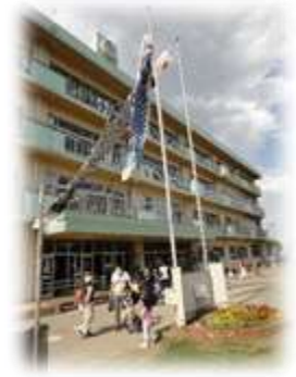
(引き渡し後の下校の様子)

引き渡し訓練、ご協力ありがとうございました。おかげさまでスムーズな人の流れと時間内のお子様の引き渡しができました。この場を借りてお礼を申し上げます。子供たちは昨年度から校内での「シェイクアウト（揺れが起きたら机の下に入って頭を守る）」がよくできています。昨年度発生した本当の地震の際もです。万一の際、お家でも応用できるとうれしいです。以下、避難訓練時の話です。