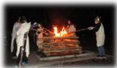
(キャンプファイア スタート)

メインは「キャンプファイア」と「カレー作り」でしょうか。「キャンプファイア」での声の大きさ、