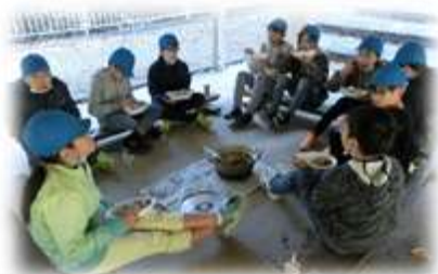
(カレーの出来は上々！)

スタントのエネルギー感はびっくりするほどでした。保護者の皆さんに観てもらえないのが残念なくらいです。ただ、子どもたちにとっていいことばかりとは限りません。班での行動や、宿泊時のルール・部屋でのマナーなど、我慢することも多々あったと思います。それを乗り越え、仲良く過ごせたことが立派だと思えるのです。